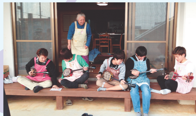
◆縁側で三線(さんしん)を弾く