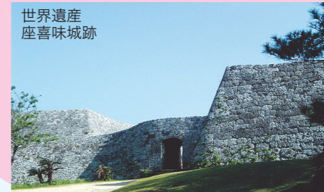
世界遺産 座喜味城跡