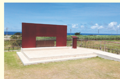
「さとうきび畑」歌碑

戦争でたくさんの尊い命を失いました。 平和が大切。元気が大切。 明るい笑顔で皆がすごせますようにと 平和に感謝し、命に感謝し精一杯生きる ことの大切さ、「命こそ宝」とは沖縄の 平和を祈る心です。