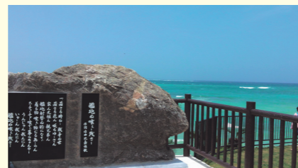
「艦砲め喰えー残さー」歌碑

日帰り民家へお邪魔し、地域の方々とふれあい、 交流を通して沖縄の生活様式や風習・伝統芸能や 文化を肌で感じるプランです